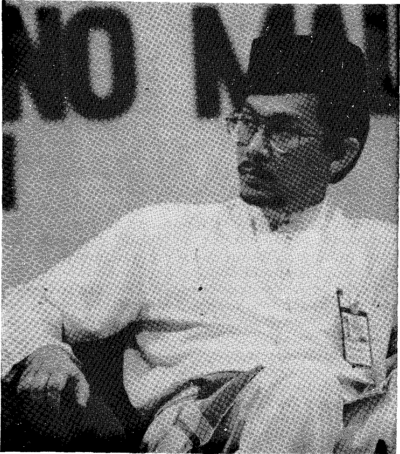
Saudara Anwar Ibrahim Presiden UNESCO