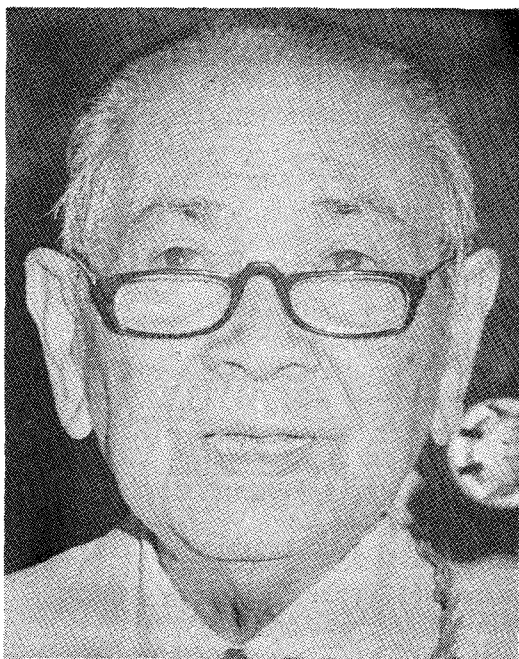
Tunku Abdul Rahman: Aktif, sampai bila-bila, menentang Dr. Mahathir

Semua yang di atas adalah di luar dugaan sebelumnya. Kehadiran Tunku Abdul Rahman ke Persidangan Agung Semangat 46 adalah perkara biasa. Cemuan Tunku Abdul Rahman ke atas Dr. Mahathir Mohamad dan UMNO Baru, adalah juga perkara biasa. Tunku Abdul Rahman telah berulang kali menghentam Dr. Mahathir Mohamad, sejak pilihanraya kawasan Johor Bahru lagi. Ketika itu Tunku bersungguh-sungguh memastikan agar Dato Shahrir Samad menang. Dan memang Dato Shahrir Samad menang. Tidaklah terfikir oleh Tunku Abdul Rahman, bahawa Dato Shahrir kemudiannya kembali memasuki UMNO pimpinan Dr. Mahathir Mohamad.