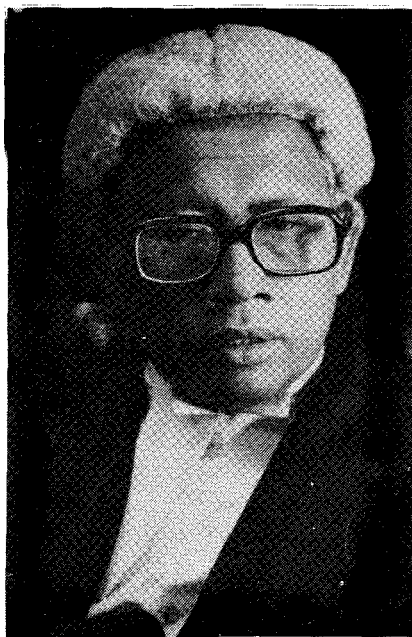
Tun Salleh Abbas: Isu pemecatannya tenggelam apabila timbul isu-isu baru

Tengku Razaleigh Hamzah menerima hakikat bahawa ekonomi sekarang sudah pulih. Cuma, beliau mengatakan keadaan pulih ini bukan kerana kemahiran pihak kerajaan, tetapi kerana kerajinan rakyat. Walau apa pun yang dikatakan, yang penting sebagai ahli ekonomi beliau boleh menerima kenyataan.