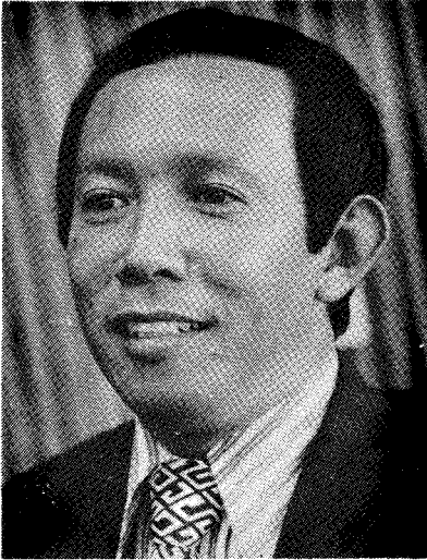
Dato Musa Hitam: Watak kontroversial dalam politik Malaysia. Beliau hanya maju dengan cemerlang jika direstui oleh Dr. Mahathir

Dato Musa Hitam adalah watak kontroversial dalam politik Malaysia, bermula dari tarikh beliau meletakkan jawatan sebagai Timbalan Perdana Menteri iaitu pada tahun 1986 yang lalu. Sebahagian besar daripada masalah-masalah dalam UMNO adalah hasil daripada tindakan-tindakan beliau yang disengajakan.