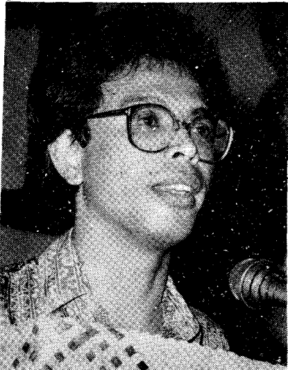
Dato Shahrir Samad berkelakuan ganjil dalam tahun-tahun 1987 dan 1988

Dato Rais Yatim dahulunya terkenal dengan frasa “membakar jambatan”. Frasa itu dikemukakan untuk membuktikan penolakan total, atau penolakan yang bersungguh-sungguh terhadap pentadbiran Dr. Mahathir Mohamad. Oleh sebab beliau menolak Dr. Mahathir Mohamad secara bersungguh-sungguh, beliau mestilah menerima Tengku Razaleigh secara bersungguh-sungguh juga. Seterusnya, oleh sebab UMNO mempunyai MCA , beliau terpaksa berusaha bersungguh-sungguh membuktikan penerimaan Semangat 46 terhadap DAP .