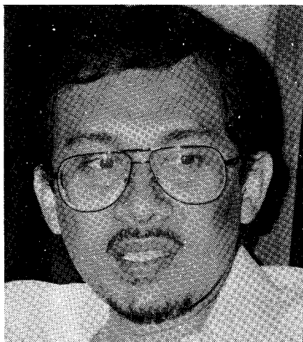
Anwar Ibrahim: Di antaranya berwibawa sebagai pemimpin – tokoh ukuran

Saudara Anwar Ibrahim sentiasa menggunakan fikirannya untuk menghadapi masalah kemerosotan populariti. Tidaklah tepat jika dikatakan bahawa beliau sentiasa memelihara populariti, kerana pada masa beliau mengetuai ABIM dahulu, beliau popular kerana pencapaian, bukan kerana usaha-usaha tertentu untuk menjadi popular. Hal ini boleh dibandingkan dengan Ustaz Abdul Hadi Awang sekarang, yang popular kerana pencapaian dan kesungguhan, bukan kerana usaha-usaha tertentu untuk menjadi popular.